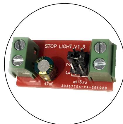
МЕСТНЫЙ А МАСШТАБ 2 : 1